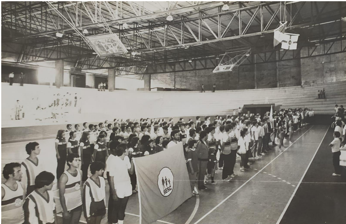
Solenidade de abertura dos 12º Jogos Abertos de Apucarana no Lagoão em 1982