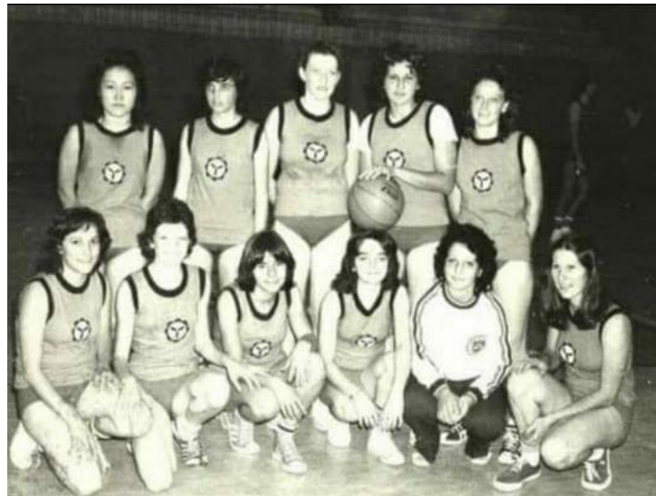
A seleção de basquetebol feminino de Apucarana foi medalha de prata em 1977