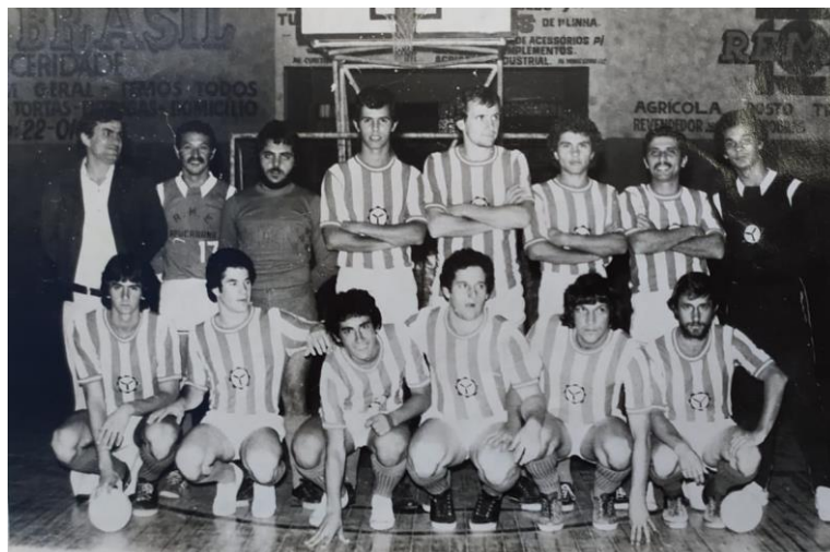
O time de futsal apucararense foi terceiro colocado nos Jogos Abertos do Paraná