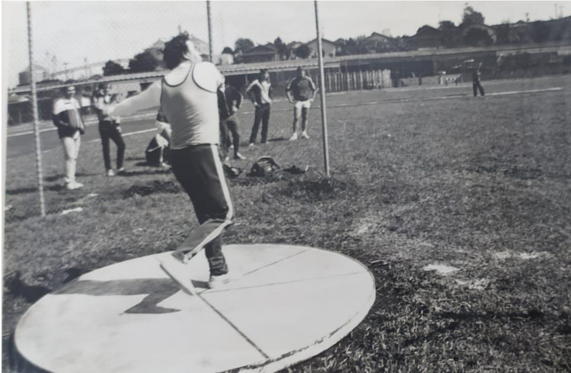
Mirão, prefeito de Apucarana de 1977 a 1982, foi bicampeão sul-americano nas provas de lançamento de disco e martelo